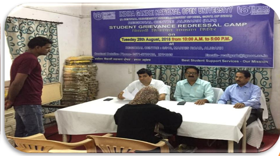
Student Grievance Redressal Camp