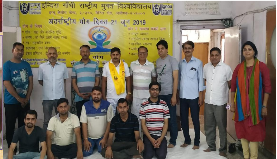
International Day of Yoga