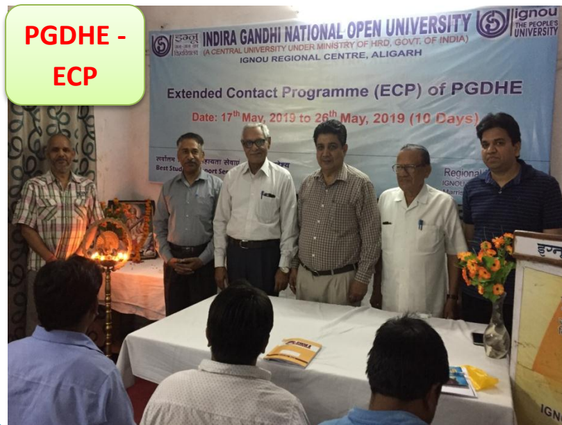
PGDHE - ECP