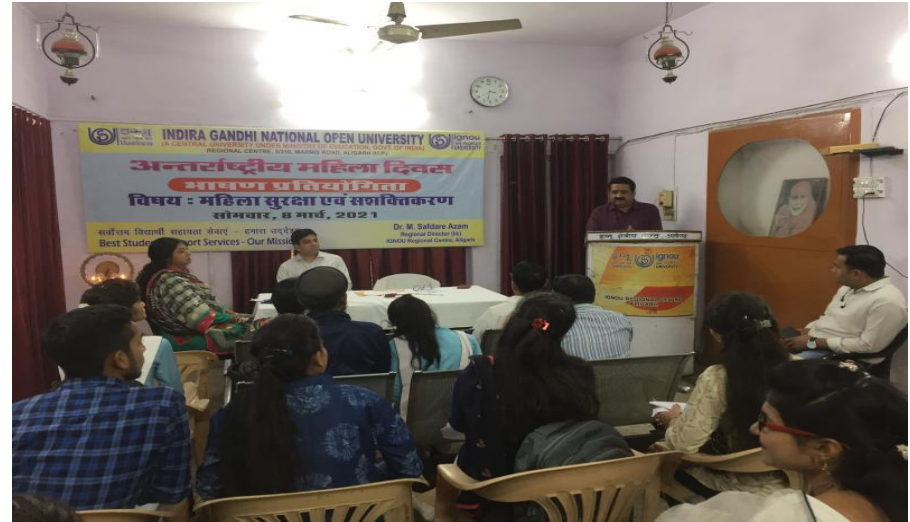
Celebration of International Women's Day