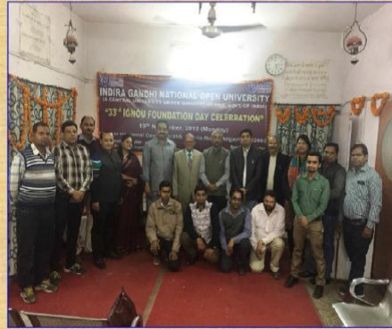
33 rd Foundation Day