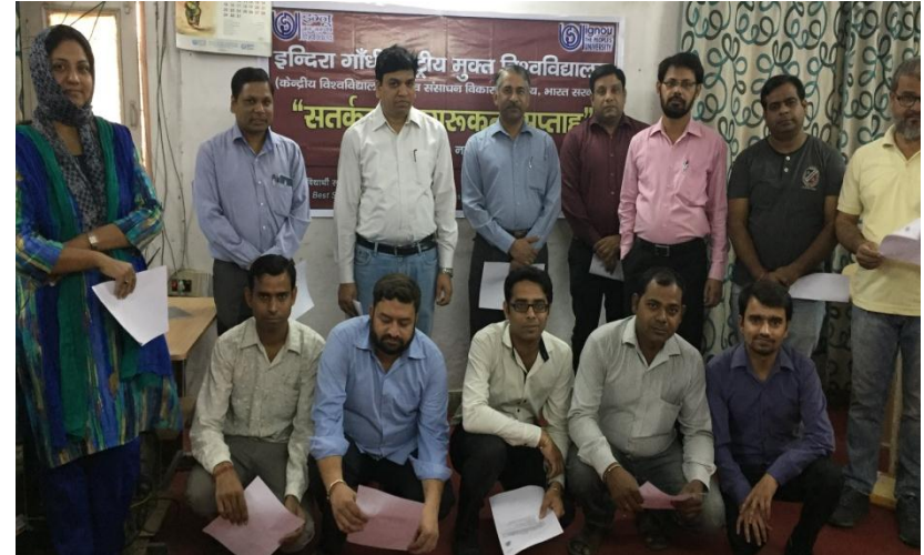
Vigilance Awareness Week