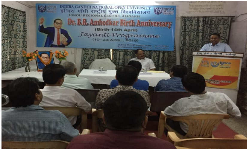
Dr. B.R. Ambedkar Birth Anniversary